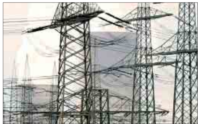
Kohlekraftwerk und Stromleitungen: Nach dem Willen der EU sollen Produktion und Stromnetz künftig getrennten Firmen gehören.

Mit dem bisher weitreichendsten Eingriff der EU in die europäische Energiebranche will Energiekommissar Andris Piebalgs die großen Versorger zwingen, die Kontrolle über ihre Leitungsnetze komplett abzugeben. So der Gesetzesentwurf, der dem „Handelsblatt“ vorliegt. Darüber hinaus plant Piebalgs eine strenge Preisaufsicht über den Großhandel mit Strom und Gas. Au-