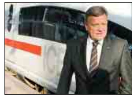
Bahnchef Hartmut Mehdorn: Umsatzsteigerung im ersten Halbjahr 2007.

Das Geschäft der Bahn wird in diesem Jahr nach Angaben des Konzernvorstands besser laufen als ursprünglich vorhergesagt. In den ersten sechs Monaten, also noch vor den Warnstreiks,