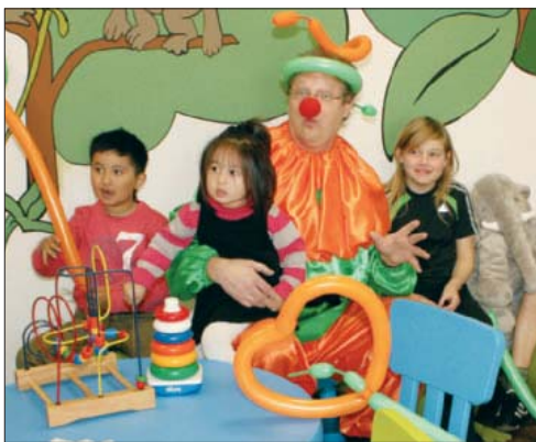
Kindgerecht: das Wartezimmer für die kleinen Patienten.